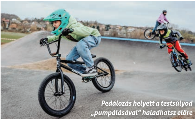
Pedálozás helyett a testsúlyod „pumpálásával” haladhatsz előre