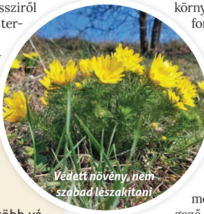
Védett növény, nem szabad leszakítani

A tavaszi hérics megjelenése minden évben emlékeztet minket arra, milyen értékes természeti környezet vesz minket körül, és hogy érdemes kilátogatni dombjainkra kisebb-nagyobb sétákra. Fontos, hogy vigyázzunk környezetünkre, hogy továbbra is büszkéek lehessünk erre a különleges vadvirágra. PERGER ANDRÁS