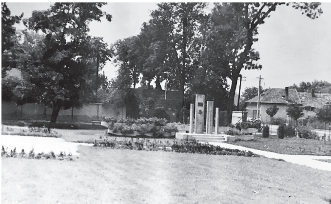
Az egykori Köztársaság tér a felszabadulási emlékművel