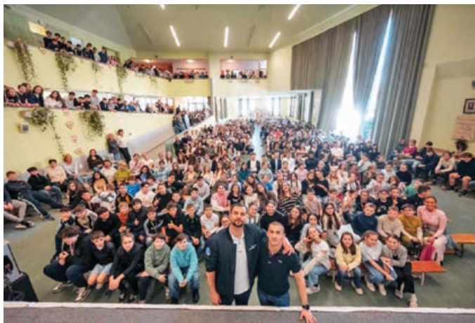
Magyar űrhajósok a népes hallgatóság előtt

Kapu Tibor és Cserényi Gyula kutatóűrhajósok tartottak előadást Pécelen március 18-án. Az iskolások lenyűgözve hallgatták az élménybeszámolót.