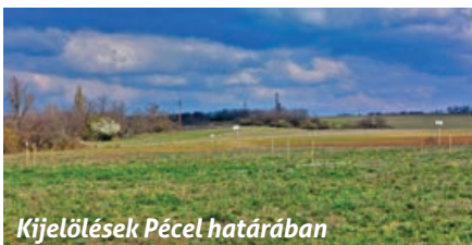
Kijelölések Pécel határában

A Napunk című internetes újságban megjelent információk alapján arra lehet következtetni, hogy a jelölések egy nagyobb energetikai fejlesztéshez kapcsolódnak: a MOL új, Pozsony és Százhalombatta közötti termékvezetékének előkészítő munkálatai zajlanak itt. A beruházás nem teljesen új nyomvonalon halad, hanem részben már meglévő vezetékek – a Barátság kőolajvezeték, illetve egy Szlovákia felé tartó gázvezeték – mentén épül, ami jelentősen leegyszerűsítette az engedélyezési folyamatot.