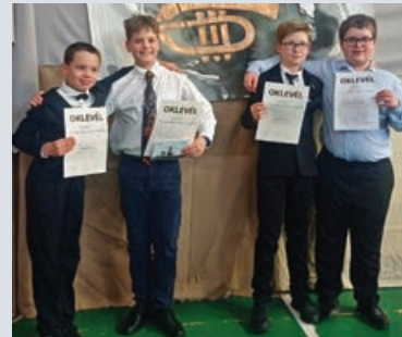
A díjazott rézfűvösök

Április 1-én kilencedik alkalommal rendezték meg a Pest Vármegyei Rézfűvös Versenyt Gödön. A verseny fő célja évek óta a tehetségek felkutatása, valamint szereplési lehetőség biztosítása a fiatal zenészek számára.