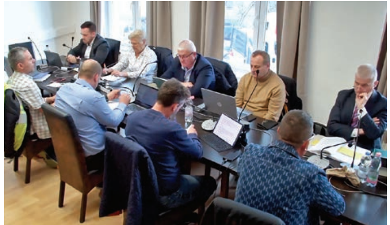
Képviselők a rendes testületi ülésen

Egyhangú döntéssel járult hozzá a testület ahhoz, hogy a jövőben a polgármester az eddigi 500.000 forint helyett 1.000.000 forint összeghatárig dönthesen saját hatáskörben az önkormányzat felé fennálló lakossági tartozásokat érintő részletfizetések engedélyezése ügyében. Mindez gyorsabb ügyintézt jelent az érintettek számára.