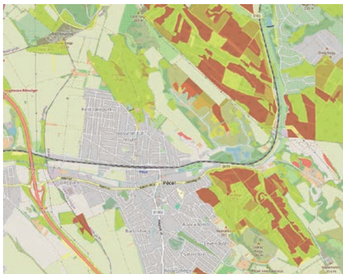
Pirosal jelölve a közepes és nagymértékben tűzveszélyes területek Pécelen

Bár a nyári időszakban a szabadtéri tüzek kerülnek előtérbe, nem szabad megfeledkezni az otthoni biztonságról sem. A lakástüzek leggyakoribb okai között szerepel a nyílt láng használata, az elektromos berendezések hibája, vagy a kar-