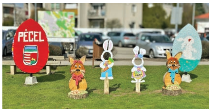
Horgolt tojás az Péceli Ügyes Kezektől

Már megszokhattuk, hogy a Péceli Ügyes Kezek csoport minden jelesebb ünnepre valamilyen alkotással lepi meg a várost a Penny előtti körforgalomnál. Tavaly húsvétkor mutatkoztak be először a horgolt tojásokkal (a 2025. áprilisi számban írtunk a kezdeményezésről bővebben), a karácsonyi ünne-