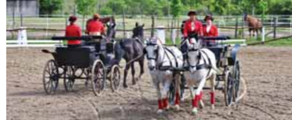
Végzett tanulóink fogatot hajtanak