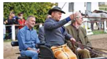
A polgármester és az igazgató úr a megnyitón

A péceli családok évről évre szívesen látogatnak ki az eseményre. Ezen a napszabású rendezvényen láthattunk fogathajtást, lovakkal táncolókat, hosszú száras bemutatót, karusszelt, ugróparádét, trail lovaglást, és bepillantást nyerhettünk a marhabírálathoz.