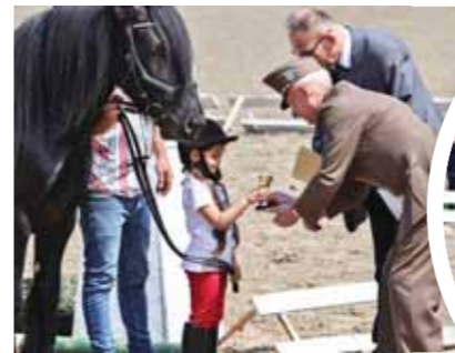
A legkisebb lovasok is megmutatták tudásukat

2024. április 27-én zajlott az immár hagyományos Fáy Lovasnap a Kishársas tangazdaságban. Egy olyan nap, amely gyerekekről szól gyerekeknek, hiszen a Fáy tanulói megmutathatják a városnak tudásukat, rátermettségüket. Kicsi, nagy együtt, egy lovasközösségben, nézőként, lovon, ló mellett, sok-sok interaktív játékkal.