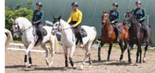
Végzős lovasok bemutatója