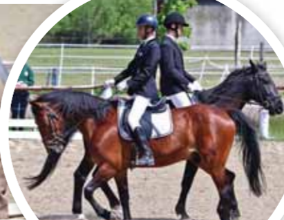
Osszhang és fegyelem