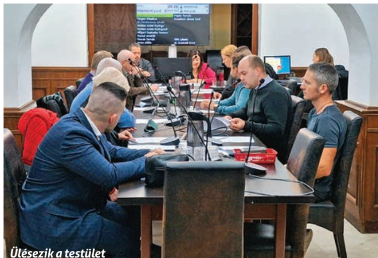
Ülésezik a testület

A térfigyelő kamerák telepítésével kapcsolatos döntésekről, a péceli civileknek szóló pályázati felhívásról, valamint a Pécel Kft.-vel kapcsolatos döntésekről lásd a 8., 11. és 18. oldalakon olvasható cikkeket. ESZ