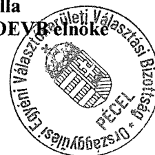
Róthné Lauf Csilla Pest Vármegye 07. számú OEVB elnöke