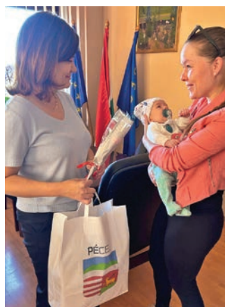
A csomagot egy kérelem kitöltésével lehet igényelni

az újszülöttről. A kérelem benyújtásakor a személyes iratokat is szükséges magukkal vinni a kérelmezőknek.