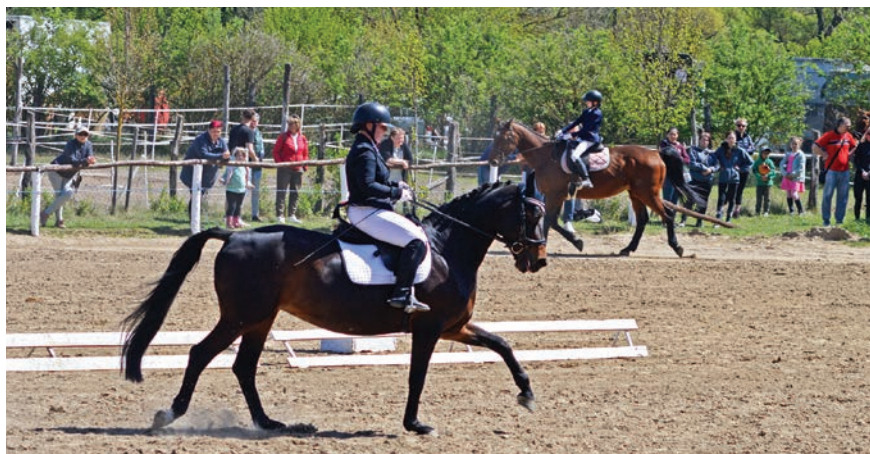
Látványos lovas bemutató