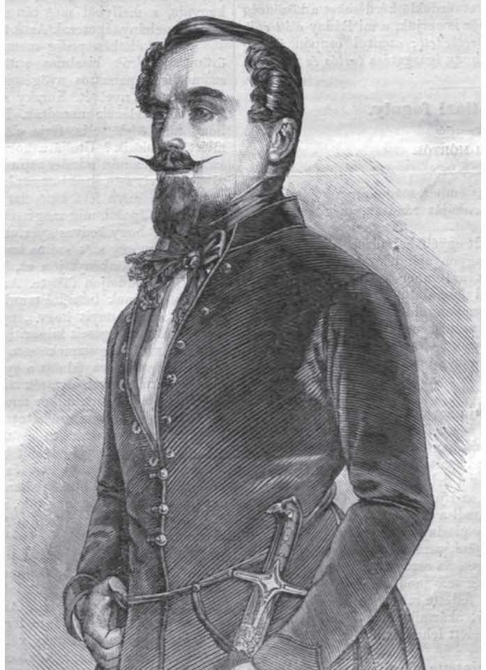
Ráday Gedeon (1806–1873)

Ráday Gedeon volt az, aki Jókai Mór és a kor ünnepeit színésznőjének esküvőjét is leszervezte. Mivel Pécelen ekkor még nem volt római katolikus templom, a szertartást Rákoscsabán tartották (ott is látható jelenleg az egyházi esküvőnek emléket állító emléktábla), de a szerény ünnepi összejövétel már Pécelen zajlott. Nyáry Pál volt Jókai, Ráday Gedeon pedig Laborfalvi Róza tanúja – ahogy azt Bory István Pécelen élő irodalomtörténész még 1933-ban kinyomozta. A fiatalok a kastélyban tölthettek még pár kellemes napot. A márciusi pillantásból augusztusban esküvő lett, majd 38 évnyi házasság.