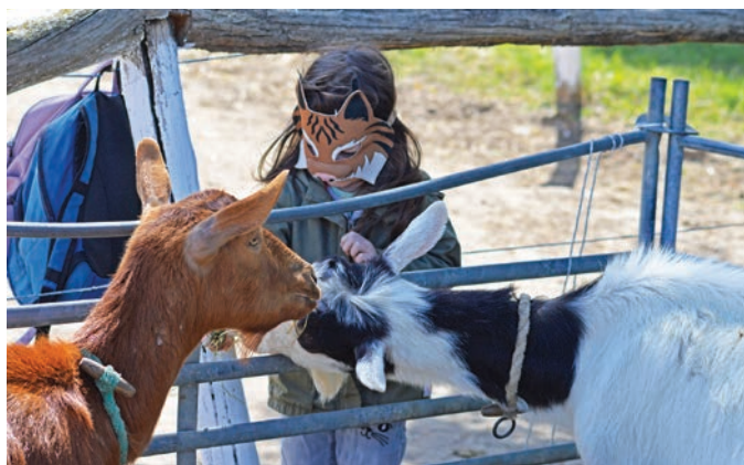
Ismerkedés az állatokkal

Miközben a pályaépítők a pálya átrendezésén szorgoskodtak, addig a gyermekek a nagy kedvenc interaktív, ló vontatta „varázsszőnyegen” csúszhattak.