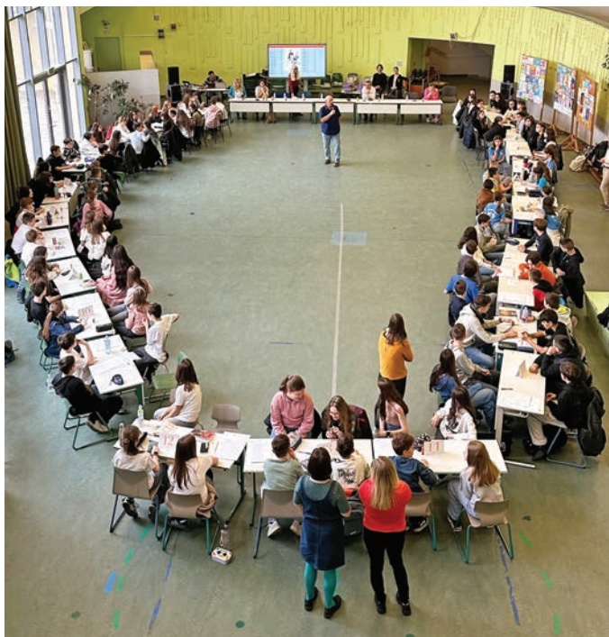
A feladatokat megoldó diákok

Március 31-én nagyszabású tankerületi szintű irodalmi vetélkedő volt a Szemere iskolában. A megmérettetés témája Arany János örökbecsű műve, a 180 éve íródott Toldi volt. A tankerület 13 iskolájából 25 csapat vett részt a jó hangulatú, izgalmas vetélkedőn, melynek végén a gyermekek értékes könyveket és édességeket kaptak.