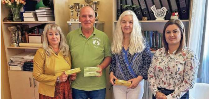
Tavaly szeptemberben adták át az első EpiPen tollinjekciókat az intézményvezetőknek

Önkormányzatunk szervezésében április 24-én a Bethesda Akadémia szakemberei tartottak képzést a helyi nevelési-oktatási intézmények kijelölt dolgozóinak anafilaxia témakörben.