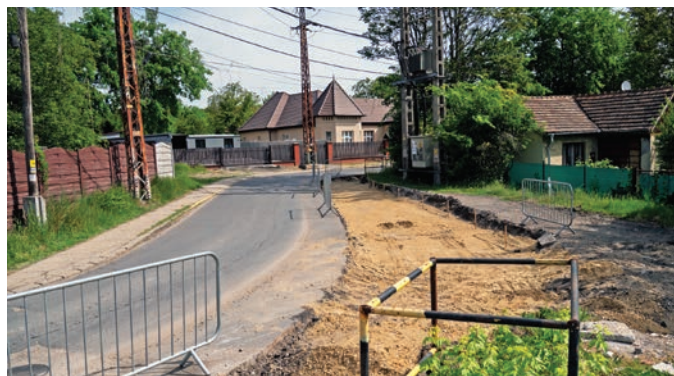
A Rákóczi út végén a kanyar is biztonságosabbá válik

A Maglódi úttal kapcsolatos felújítás állami beruházás, azonban önkormányzatunk bizonyos szempontból mégis jelen van, hiszen megvásároltuk a kitermelt martaszfal-