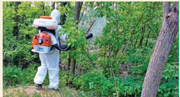
A fiatal, sárgás lárvák májusban, tavasszal bukkannak fel

Az utóbbi hetekben országszerte több helyen is elszaporodtak a pókhálós molyok. A kártevők hernyói sűrű, pókhálószerű szövedékekkel borítják be a fákat és bokrokat, miközben a leveleket is károsítják. A tömeges megjelenés látványos ugyan, de a növények számára komoly terhelést jelenthet, különösen akkor, ha nagyobb területen szaporodnak el. A szakemberek szerint a védekezést érdemes időben megkezdeni, hogy megelőzhető legyen a további terjedés.