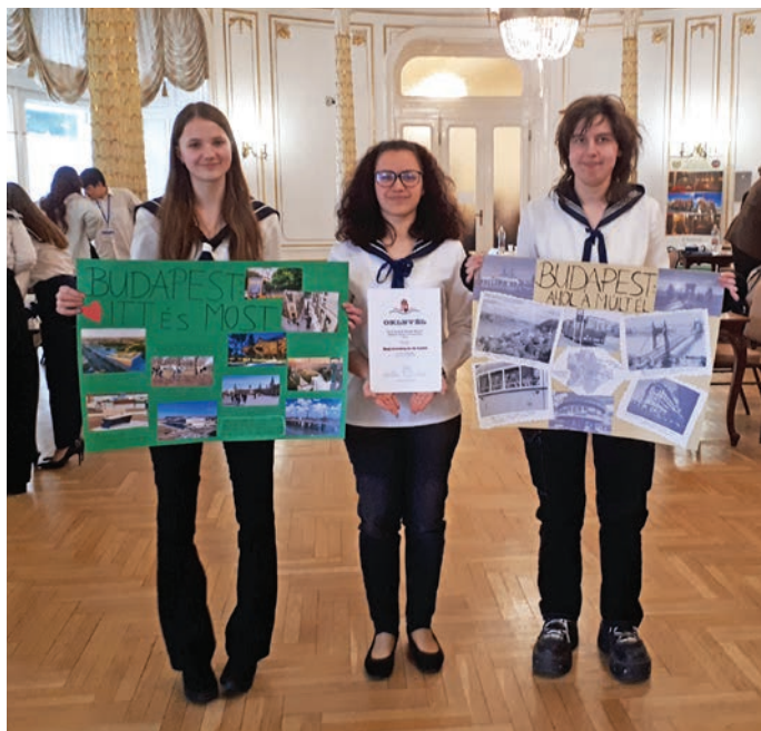
Budapest elmúlt száz évének változásait mutatták be