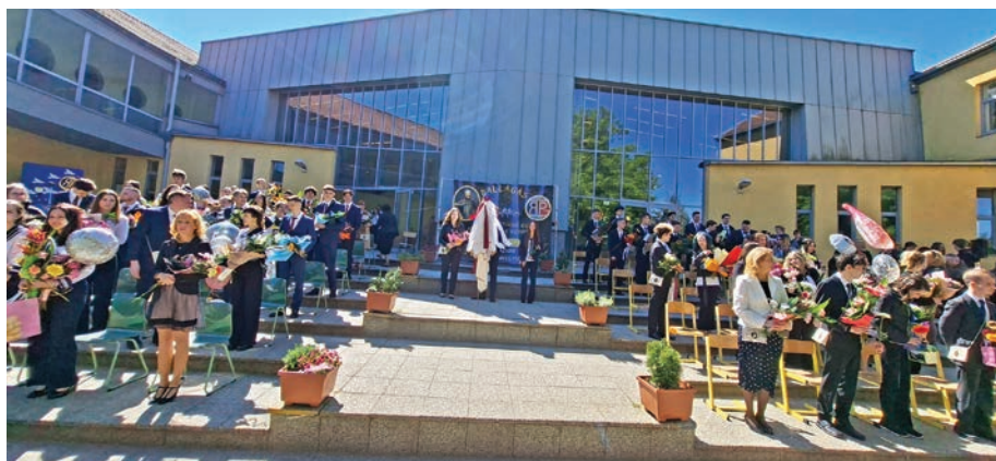
Ünnepség a gimnázium udvarán

A gimnázium 11. évfolyamosai nemcsak a szervezésben mutatták meg fiatalos lendületüket, hanem jókívánásaikban is.