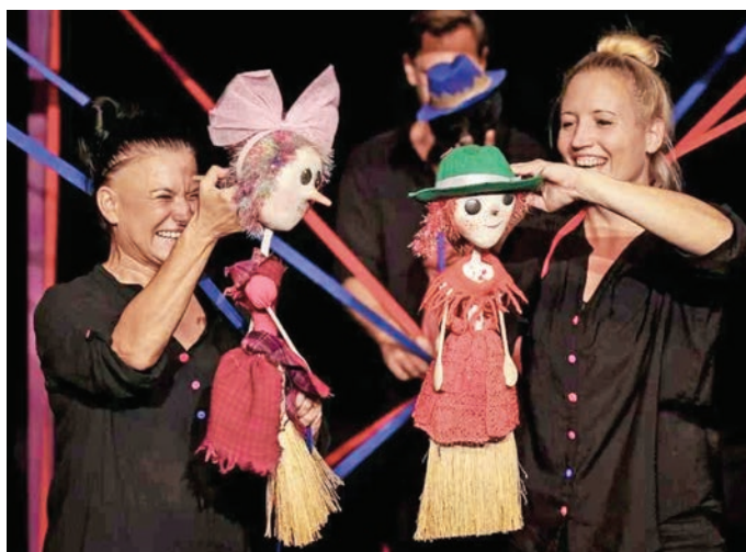
Lázár Ervin egyik meséje is színpadra kerül

A délután egyik különleges programeleme a 15 órakor kezdődő „Állati jó” bemutató lesz, amely minden bizonnyal sok érdeklődőt vonz majd. Ezt követően 16 órától a Péceli Kutya-