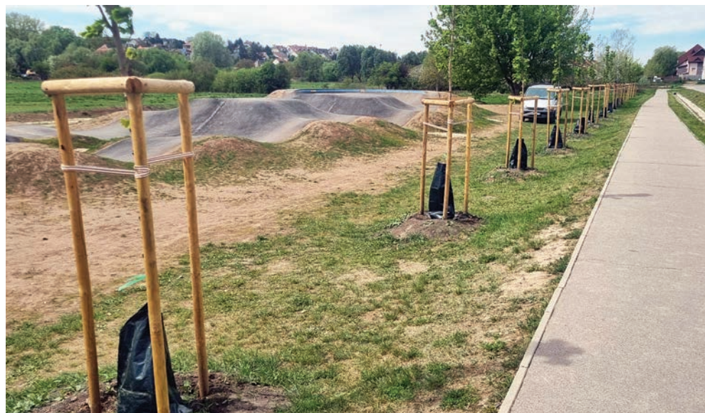
Locsolózsákok segítenek a fáknek a Topolyosban

Január 46,2 millimétert hozott, ami 41%-kal meghaladta az átlagot, február 36,4 milliméterrel gyakorlatilag átlagos volt, március viszont már csak 22,5 millimétert adott, ami 34%-