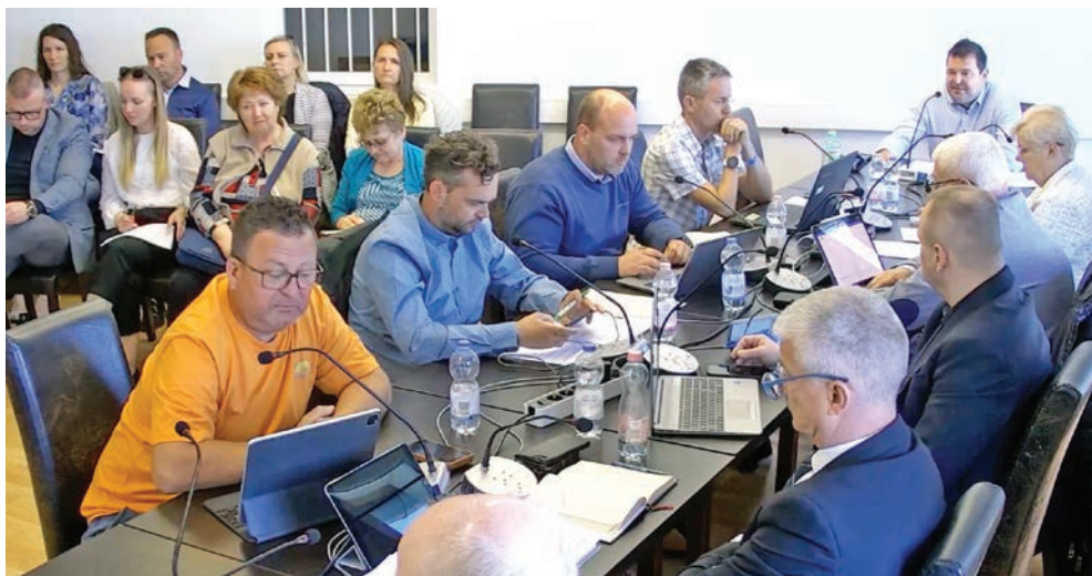
Képviselők az áprilisi ülésen

Az áprilisi testületi ülésen a képviselők többek között tárgyalták a Pécel Kft. működésével kapcsolatos kérdéseket, döntöttek egyedi támogatásokról és az idei év igazgatási szüneteiről is.