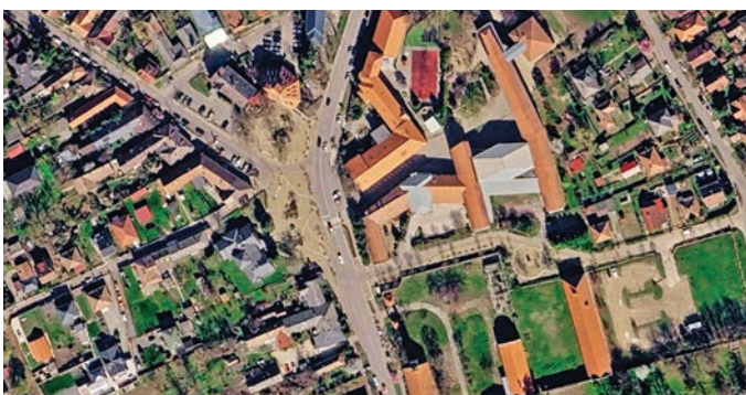
A dokumentumok meghatározzák a város arculatát

A településtervezési dokumentum, amely meghatározza többek között a város jövőbeni fejlesztési lehetőségeit, az építési és területhasználati elképzeléseket, valamint a közlekedési, környezetvédelmi és zöldfelületi szempontokat is. A dokumentum elkészítése ezért hosszú időre befolyásolhatja Pécel arculatát.