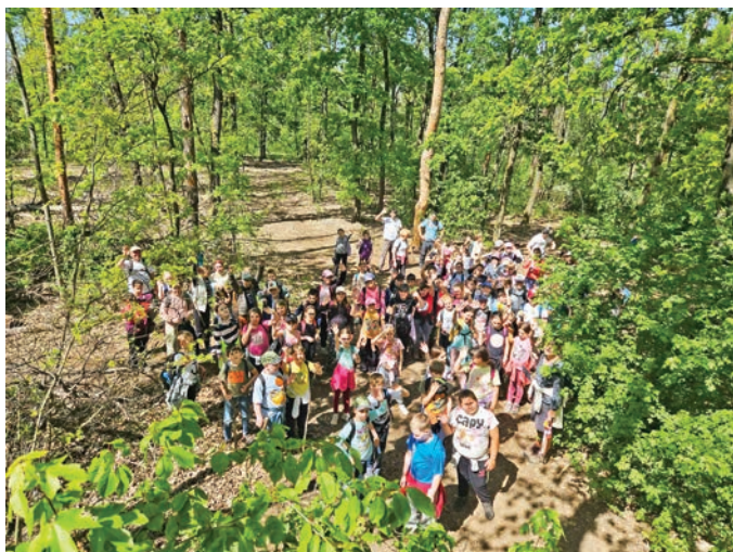
Gyereksereg a péceli erdőben

Idén is bekapcsolódott iskolánk az országosan meghirdetett Fenntarthatósági Témahétbe.