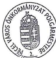
Horváth Tibor polgármester Pécel Város Önkormányzata